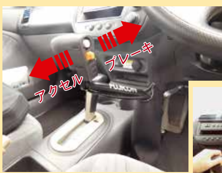
手動 運転 装置車

運転免許センターの運転適性検査室（適性相談室窓口）の身体障害者に関する相談、審査業務を行っている係で、事前に運転にかかる適性の審査を受けていただきます。（要予約）